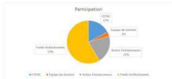
FPCI Connect Capital (29 millions d'euros)

51 millions d'euros recueillis grâce à 2 levées de fonds successives (29 millions pour la 1ère finalisée en 2007 et 22 millions pour la 2ème finalisée en 2014)